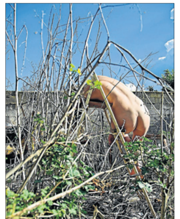
Dos de las imágenes que se pueden contemplar en el Centro Párraga hasta el 12 de octubre. MAR SÁEZ