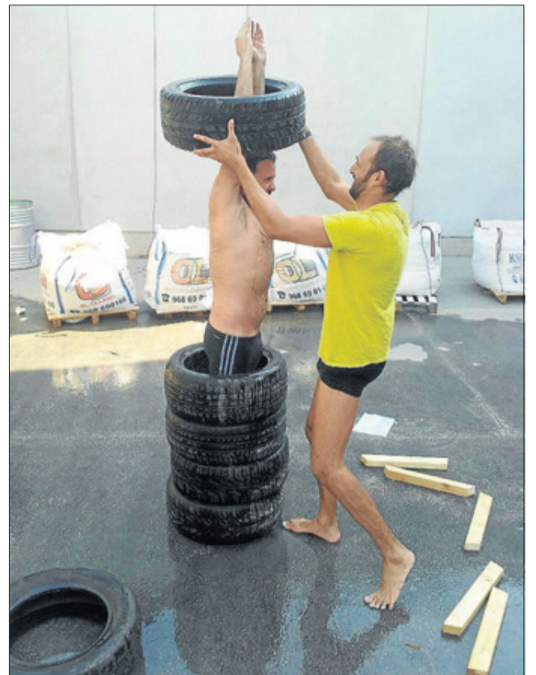
Los integrantes de MOHO Arquitectos, trabajando en La Conservera. A la izquierda, dibujo que ilustra la muestra de Lejarraga.

En el Espacio 2 del centro, el colectivo DOT Agency for Architectural Affairs -formado por los jóvenes arquitectos Gonzalo Herre-