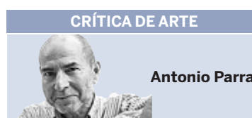
CRÍTICA DE ARTE

Dilatar el adelanto electoral en Cataluña con una crisis que estrecha cada día más el margen de maniobra de CiU se antoja todo un suicidio a fuego lento por el que no están dispuestos a pasar los nacionalistas, por eso y tal y como admitió ayer el propio Mas, el adelanto no es, tras enterrar el pacto fiscal, nada descartable. Estos próximos días serán muy intensos intramuros de CiU, pues la concentración de la Diada no ha hecho sino que resucitar a ERC y dar alas al PP, como única tabla a la que asirse en plena tormenta secesionista. Por eso no es descartable una huida hacia adelante con nuevas movilizaciones «patriotas» con las que sepultar el malestar de la crisis, el impago de salarios a los funcionarios, el deterioro de su Estado de Bienestar. Del morir de éxito a la ruina total sin apenas haber llegado a cobrar la lotería premiada.