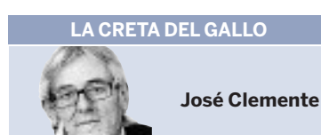
LA CRETA DEL GALLO