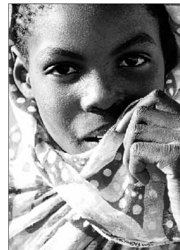
El melahfa, atuendo típico femenino

puedan dar a luz en condiciones higiénicas que difícilmente serían viables en las jaimas, donde suelen parir rodeadas de animales. A su vez, los medicamentos son accesibles para todos los habitantes con precios simbólicos y de forma gratuita para los que no poseen ningún tipo de recurso. Por último, la concienciación de la importancia de la higiene está presente a través de cursos de formación que se desarrollan semanal o mensualmente durante todo el año.